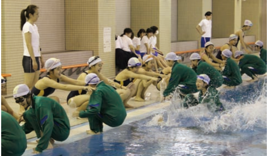
2リットルのペットボトルを使い、浮力を体感できました。

中 学2年生では、身体の成長と共に運動量や活動範囲が広がり、技術の修得過程において怪我をする可能性が出てきます。そこで、水泳の授業では健全な身体作りと安全に対する学習をしています。