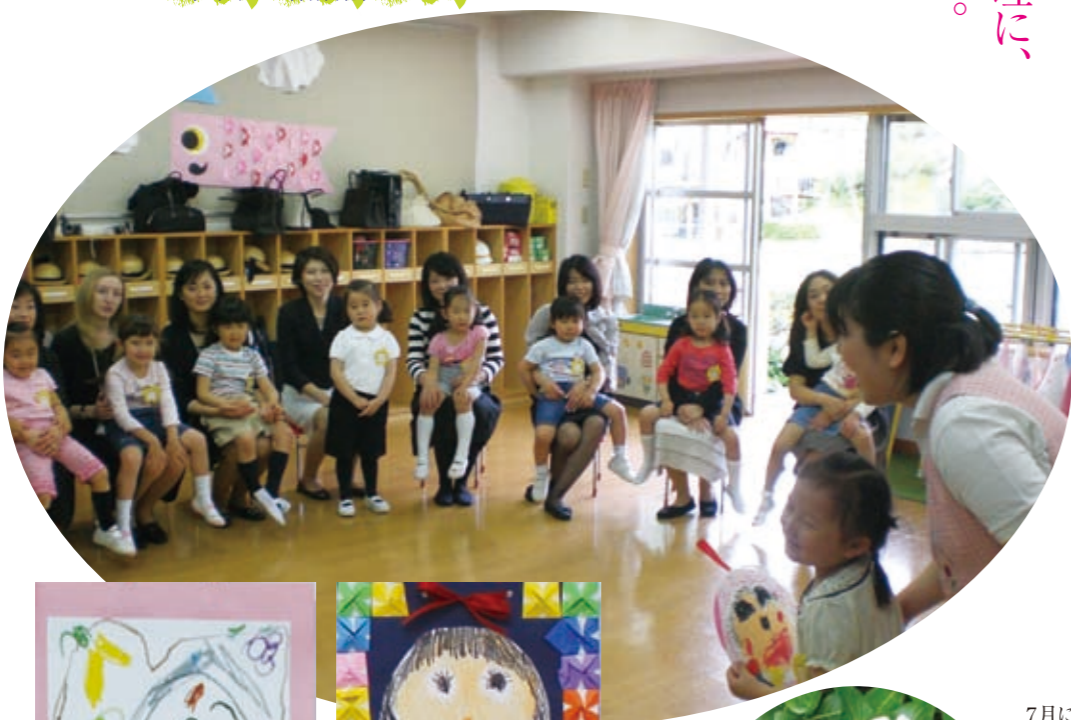
7月には、年長組が母の日参観で種まきをした日々草が咲きはじまりました。