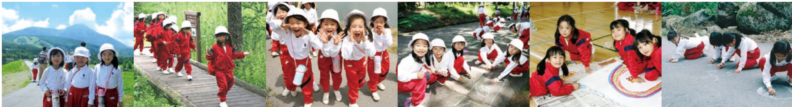
写真:左より 現1年生・2年生・3年生・4年生・5年生・6年生

6年間のカリキュラムを終えた今、一番初めの蓼科学習で印象に残っていることを教えてください。