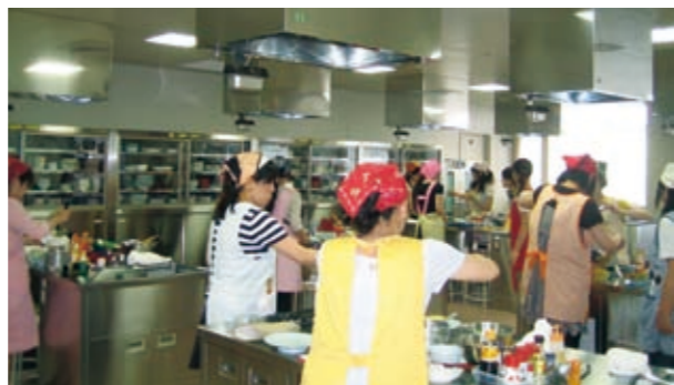
『お料理教室』(7月1日14号館 調理実習室にて実施) かぼちゃ、たまねぎ、さやいんげん、おくらがだしの違いで、全く違う味付けの碗やスープになることに驚きました。

企画すること、準備をすること、実行すること、そして達成感を味わうこと。反省することもあったりして、その経験を次回の企画に活かそうと工夫すること。そのような体験が大人へのプロセスにつながると思います。SAに参加希望の学生も随時募集しています。また、SAセンター内のフリースペースは、クラブの展示会、ライブ、ミーティングなどにも活用されています。もっともっと多くの人たちのアイデアを集めて企画を練っていきたいと思います。