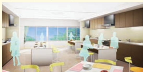
調理実習室2パース

4階・5階に理科室、アトリエ1・2、視聴覚室、家庭科室(被服室、調理実習室1・2)を設置します。上層階なので目白通り越しの景色も楽しめます。