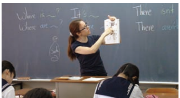
ネイティブの授業できちんとした発音を身につけます。