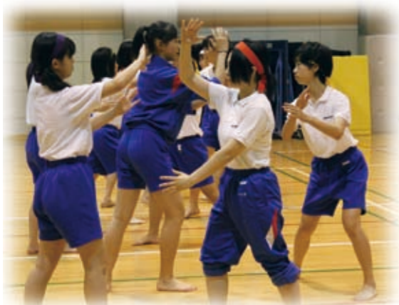
合気道指導員の先生により、気迫のこもった掛け声が響きます。

合気道では、構え、基本姿勢を繰り返し、護身技を身につけていきます。臂力の養成、体の変更、終末動作を重心移動を意識して臨みます。受身も技を体得するうえで重要となります。1学期(前期)は基本技「正面打ち一ヶ条抑え」まで進みます。2学期(後期)には生徒は、相対での基本動作が主となり、「正面打ち三ヶ条抑え」、「正面打ち四ヶ条抑え」、「片手持ち側面入身投げ」、「横面打ち正面入身投げ」まで実践していきます。