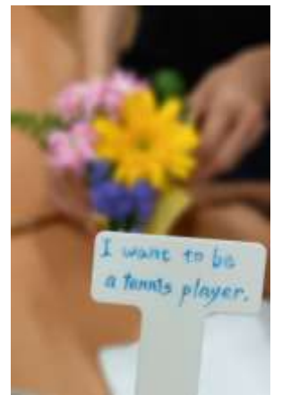
好きなお花の色を英語で伝えることができました