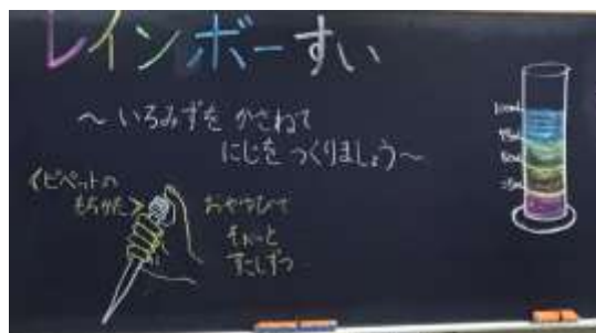
異なる濃度の食塩水を利用した実験です