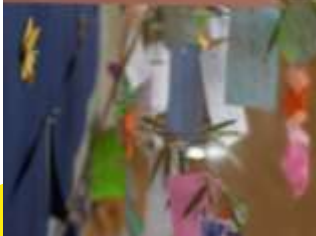
とても良い字 が書けました